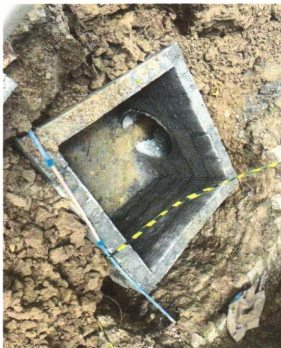
Foto 09 - ALVENARIA DE VEDAÇÃO DE BLOCOS VAZADOS DE CONCRETO DE 9X19X39CM (ESPESSURA 9CM) DE PAREDES COM ÁREA LÍQUIDA MAIOR OU IGUAL A 6M 2 COM VÃOS E ARGAMASSA DE ASSENTAMENTO COM PREPARO MANUAL. AF_06/2014