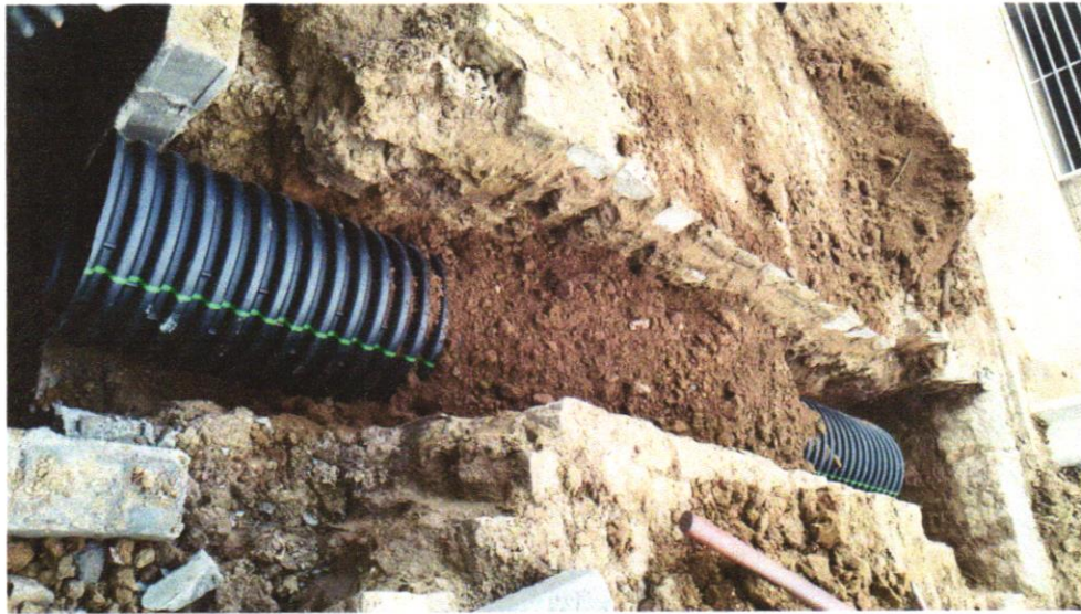
Foto 15 - FORNECIMENTO E ASSENTAMENTO DE TUBO CORRUGADO PAREDE DUPLA PEAD, D = 600 MM (24"), PARA SISTEMAS DRENAGEM, TIGRE - ADS N-12