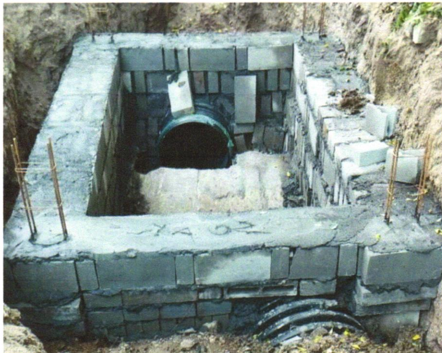
Foto 14 - FORNECIMENTO E ASSENTAMENTO DE TUBO CORRUGADO PAREDE DUPLA PEAD, D = 600 MM (24"), PARA SISTEMAS DRENAGEM, TIGRE - ADS N-12