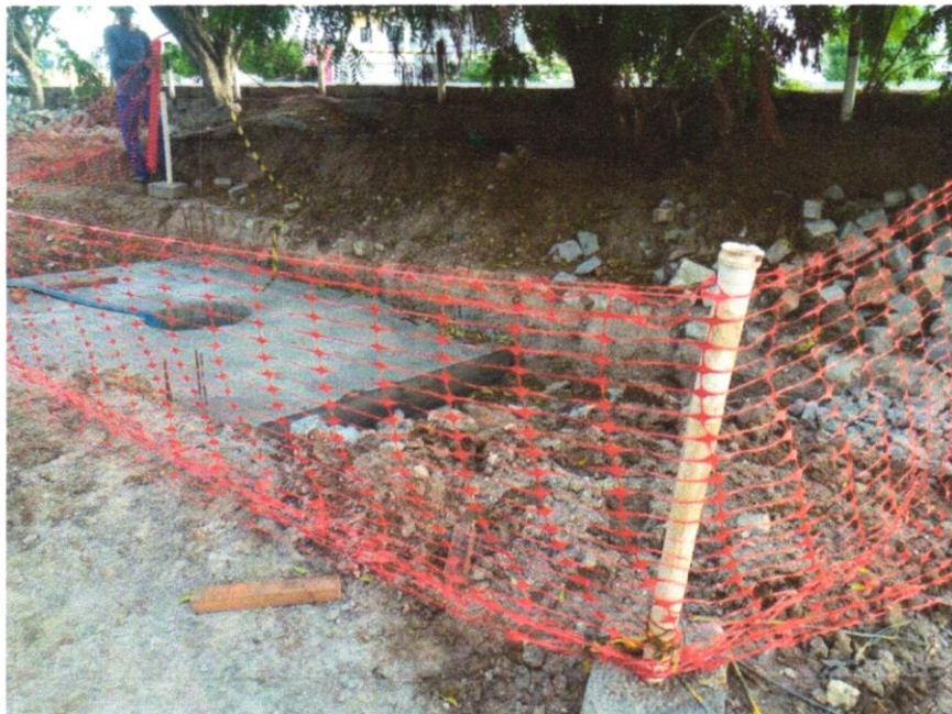
Foto 02 - Tapume de proteção em tela de polietileno h=1,20 com bloco de concreto