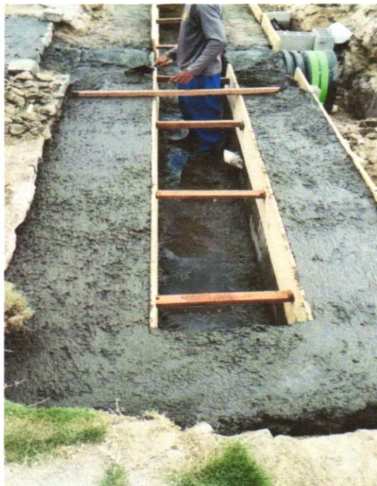
Foto 11 – CONCRETO FCK = 25MPA, TRAÇO 1:2,3:2,7 (EM MASSA SECA DE CIMENTO/ AREIA MÉDIA/ BRITA 1) - PREPARO MECÂNICO COM BETONEIRA 600 L. AF_05/2021