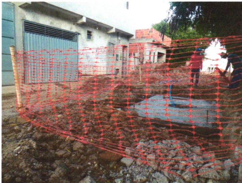
Foto 01 - Tapume de proteção em tela de polietileno h=1,20 com bloco de concreto