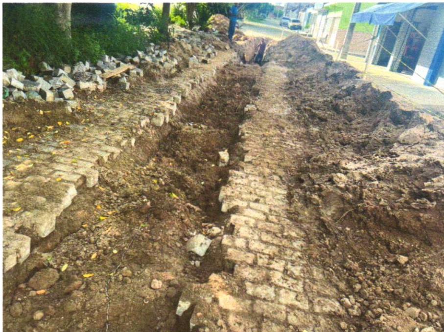
Foto 04 – ESCAVAÇÃO MANUAL DE VALA COM PROFUNDIDADE MENOR OU IGUAL A 1,30 M