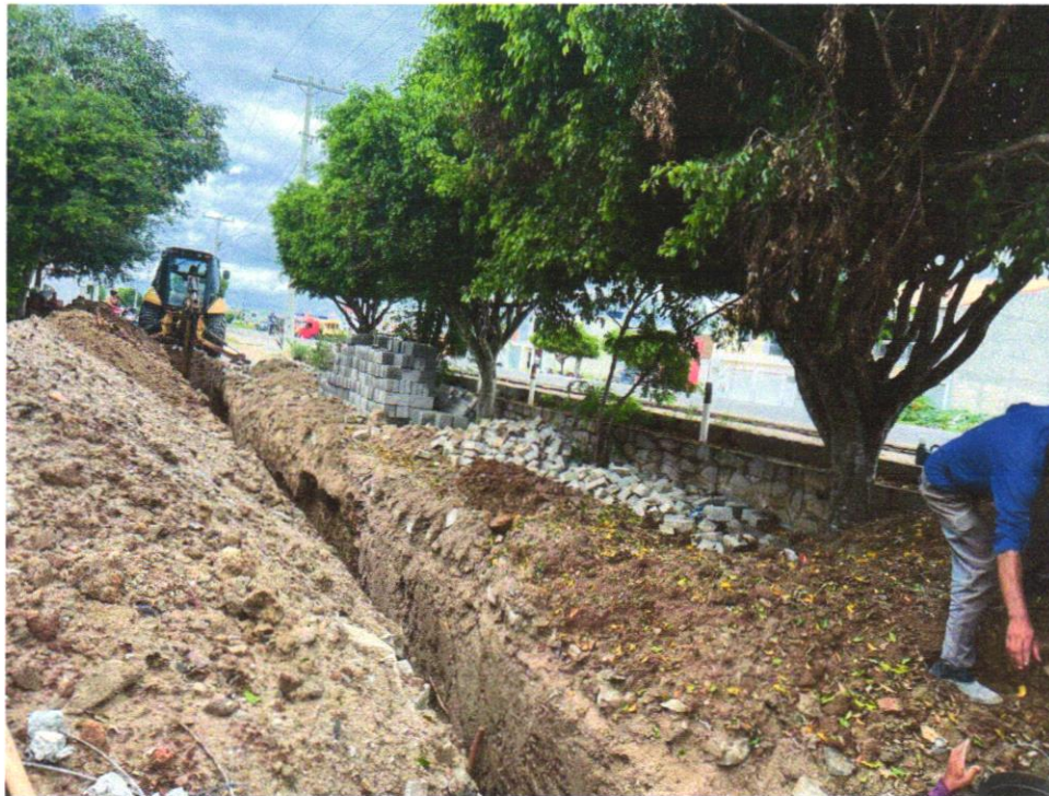
Foto 05 - ESCAVAÇÃO MECANIZADA ATÉ 1,50M EM MATERIAL DE 1º CATEGORIA PARA ABERTURA DE CORTE PARA ATERRO, SEM BOTA FORA