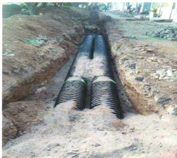
Foto 08 - ATERRO MANUAL COM SOLO ARGILO-ARENOSO IMPORTADO E COMPACTAÇÃO MECANIZADA EM CAMADAS DE 0,20 M NO MÁXIMO