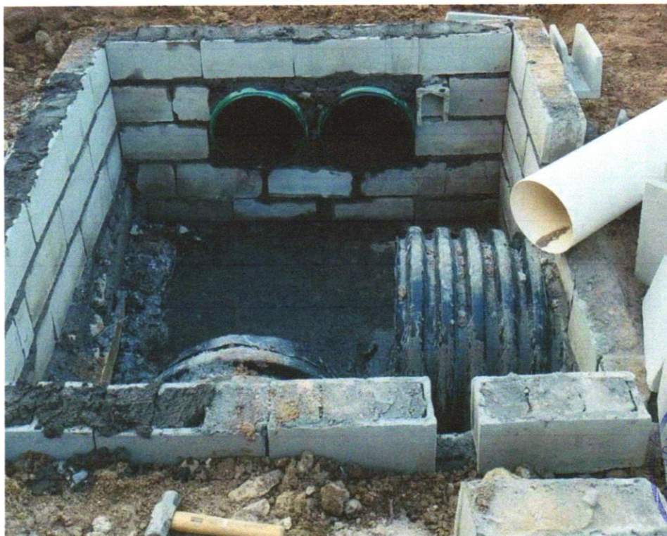
Foto 16 - TUBOS