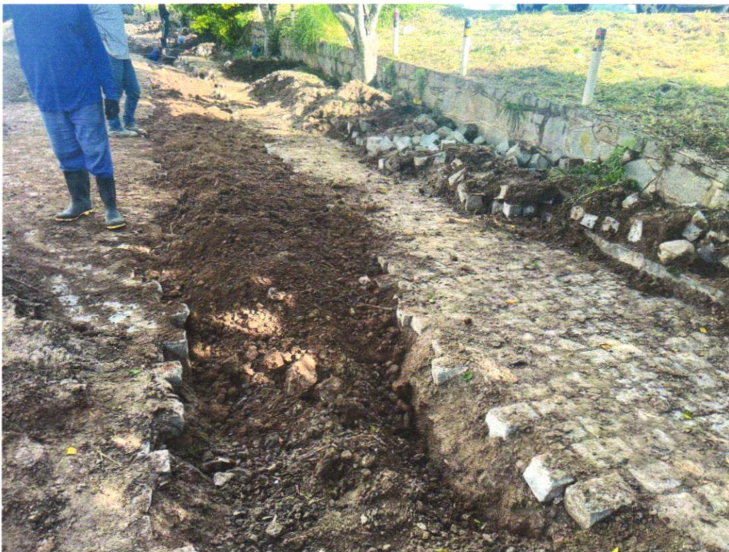
Foto 07 - ATERRO MANUAL COM SOLO ARGILO-ARENOSO IMPORTADO E COMPACTAÇÃO MECANIZADA EM CAMADAS DE 0,20 M NO MÁXIMO