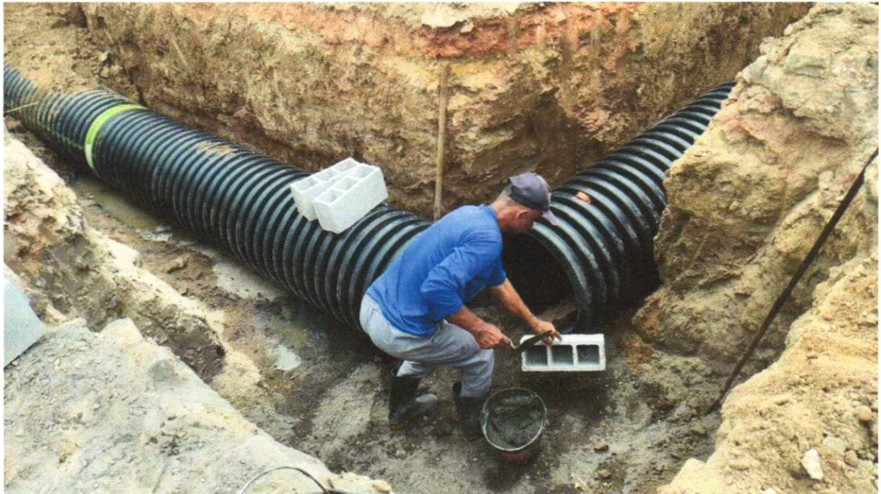
Foto 13 - FORNECIMENTO E ASSENTAMENTO DE TUBO CORRUGADO PAREDE DUPLA PEAD, D = 450 MM (18"), PARA SISTEMAS DRENAGEM, TIGRE - ADS N-12